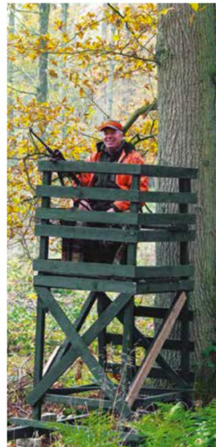
Ci-dessus, chasseur au mirador, lors d'une battue de grands animaux. En haut, à gauche, superbe brocard au lever du jour. Ci-contre, mâle de sarcelle d'hiver : sans doute l'un des plus beaux canards qui soient.

sont exponentielles depuis l'instauration du plan de chasse voilà plus de quarante ans ? Deux chiffres montrent cette évolution : on tire aujourd'hui plus de 580 000 chevreuils par an contre 60 000 en 1978, et plus de 800 000 sangliers contre... 50 000 cette même année-là !