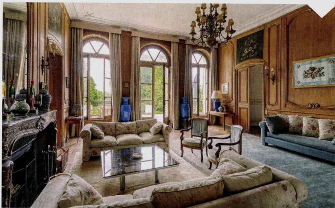
Au sud de Meaux, Daniel Féau commercialise ce château de 850 m 2 , (4,20 m), au cœur d'un parc de 18,5 hectares (1 700 000 euros).