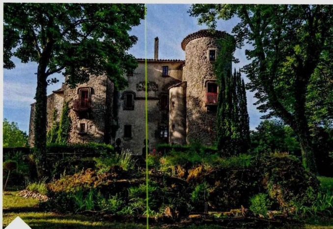
Dans l'Hérault, près de Montpellier, ce château seigneurial du XV e siècle offre 470 m 2 habitables sur 4 niveaux (Barnes, 875 000 €).

volume de nos ventes est assez stable par rapport à celui de 2023 (environ -1%, là où d'autres annoncent des baisses records), il concerne principalement le milieu rural, où le prix moyen d'une propriété s'élève à 845 000 euros, contre 935 000 euros pour les zones urbaines. Même si la France est l'un des pays qui compte le plus de châteaux, ce qui fait leur valeur, historique, sentimentale, patrimoniale et financière est leur rareté, leur caractère unique », estime Stéphane Aguiraud, président du groupe Immobilier Mercure France.