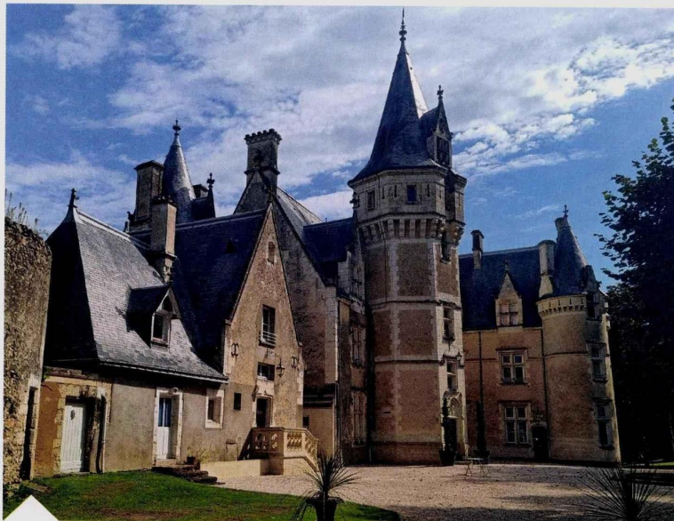
Dans la Sarthe, ce château des XV e et XIX e siècles s'étend sur environ 680 m 2 (23 pièces, 15 chambres), profitant d'un parc à l'anglaise de 25 hectares (2 640 000 €, Cabinet Le Nail).