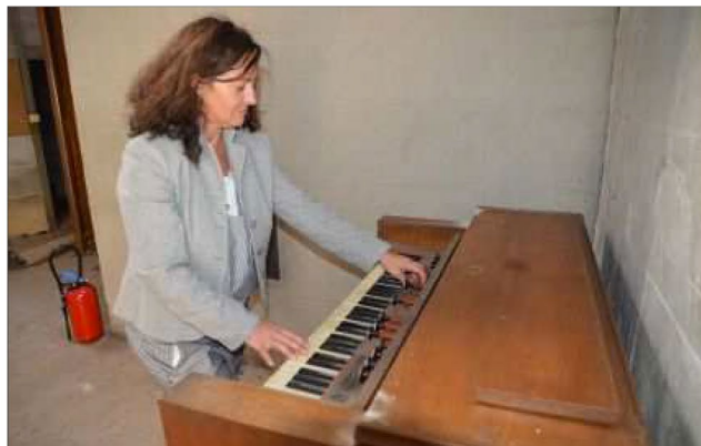
Un harmonium encore fonctionnel est cédé avec le bien.