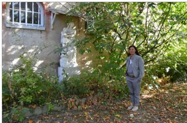
Dans le jardin de curé arboré, quelques statues ajoutent à la spiritualité des lieux.