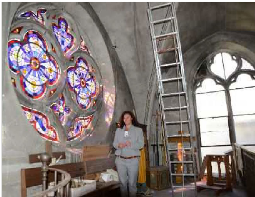
Théâtre de nombreux sacrements, évidemment des obsèques, la chapelle montargoise Saint-Louis pourrait devenir un loft, accueillir une galerie d'artistes ou pourquoi pas des touristes.