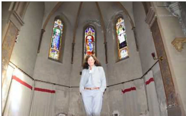
Pièces à vivre au rez-de-chaussée et chambres à l'étage ?... Ce type de pari a été relevé avec succès par un militaire dans le centre de Verdun : il a transformé un temple en gîte.